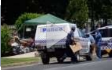
8 fratelli uccisi in Australia, sospetti sulla madre