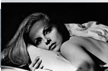
Addio a Virna Lisi, aveva 78 anni. Regina del Cinema italiano