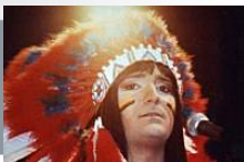
Zero, la mostra: per tre mesi il Macro di Roma rende omaggio al 're dei sorcini'