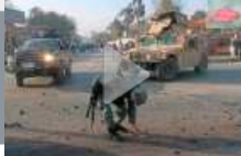
Afghanistan: talebani attaccano banca nell'Helmand, 7 morti