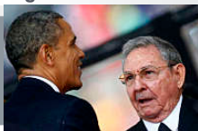
Svolta storica nei rapporti Usa-Cuba, riaprono le ambasciate