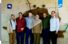
L'arrivo a L'Avana degli agenti dei servizi cubani scarcerati dagli Stati Uniti dopo il disgel Usa-Cuba