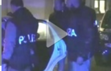
Omicidio Fanella, nuovi arresti. Tra i fermati anche un ex Nar