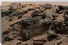
Curiosity scopre ' il metano su Marte. E' un segnale di vita?