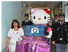
I regali di Hello Kitty e Babbo Natale ai bambini delle Scotte