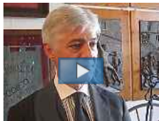
Ricci: "Questa Mens Sana è sempre più squadra"