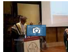
Università, inaugurato il nuovo anno accademico