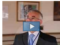
Vaccino Novartis contro il Meningococco B, intervista video a Rappuoli